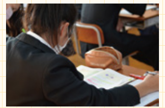
准看護師資格試験

2年生の実習終了後、看護に対する考え方や、思いを発表します。1年生にとってはこれから始まる実習に向けて看護の実践について学ぶ場になります。